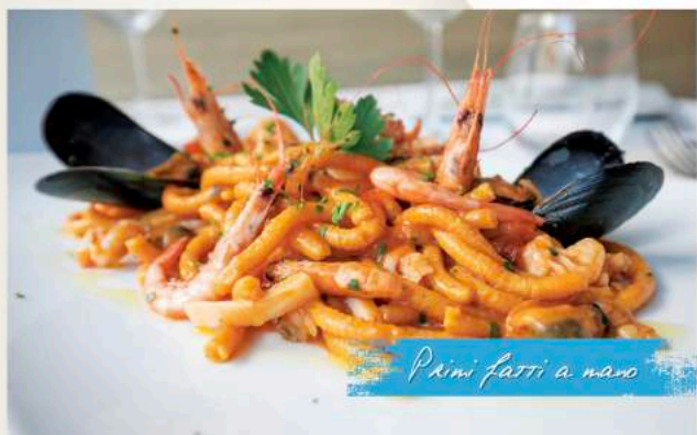
Primi fatti a mano

Vieni a trovarci in un locale completamente rinnovato nell'ambiente e nel menù.