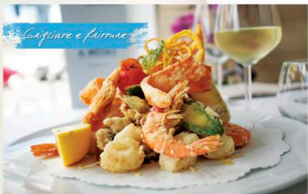
Sagliare e frittare

Realizziamo cene per eventi aziendali e grandi occasioni, richiedi un preventivo completamente gratuito e crea con noi il tuo menù personalizzato.